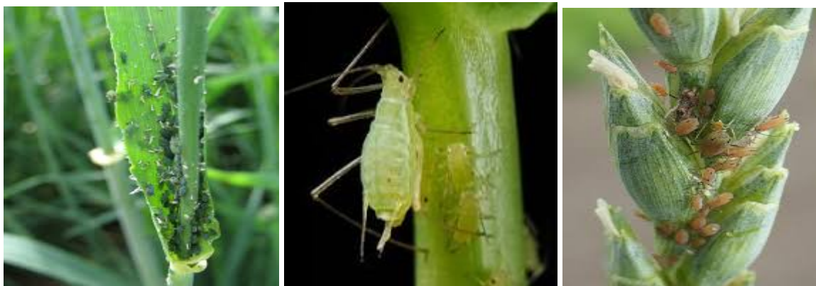
Afidele cerealelor ( Aphis spp. )