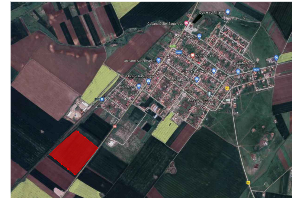
INCADRARE IN ZONA - fara scara